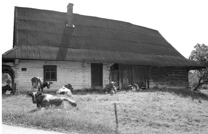
Rys. 3. Bartne 40. Chałupa półtoratraktowa z 1927 roku. Widok od frontu. Autor: A. Mikrut, 06.2016

Na obszarze środkowej Łemkowszczyzny sieni i boisko były zazwyczaj osobne. W układzie, znajdowały się obok siebie (np. Bartne 40, 24) lub były rozdzielone pomieszczeniami gospodarczymi, najczęściej stajnią z komorą (Bartne 44). W wielu budynkach jedno pomieszczenie pełniło zarówno funkcję sieni jak i boiska. Pomieszczenie to znajdowało się pośrodku, dzieląc chałupę na część mieszkalną po stronie wschodniej i gospodarczą po stronie zachodniej. Łączenie funkcji sieni i boiska w jednym pomieszczeniu nie było powszechne w Komańczy.