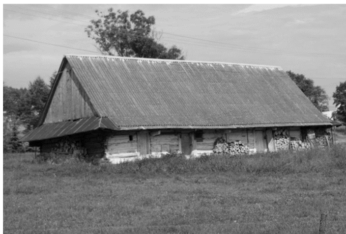
Rys. 4. Bartne 27. Chałupa z 1906r. Widok na elewację tylną. Autor: A. Mikrut, 06.2016

Fig. 3. Bartne 40. Cottage from 1927. View at the front. Author: A. Mikrut, 06.2016