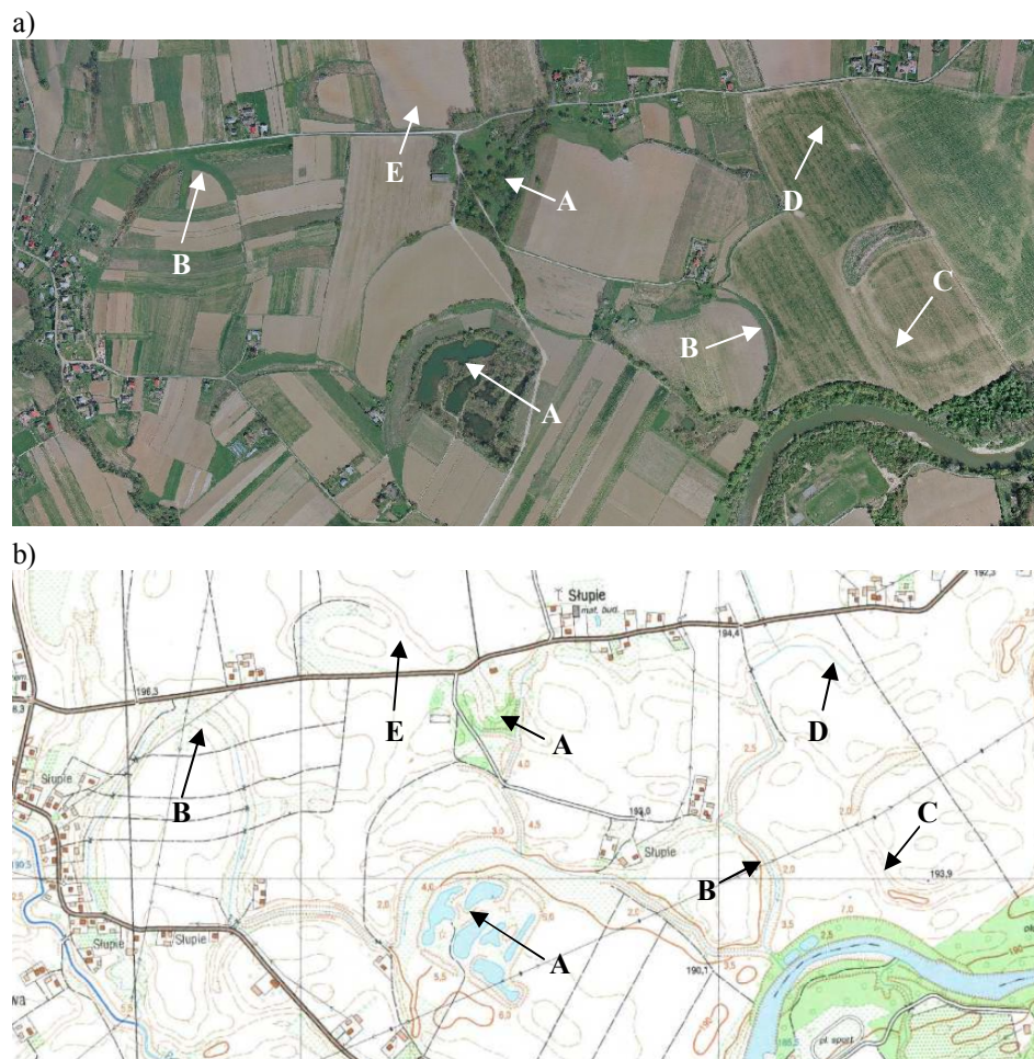
Rys. 1. Dolina rzeki Wisloka w rejonie miejscowości Chotowa: a) ortofotomapa (skala 1:20 000) [5]; b) mapa topograficzna (skala 1:20 000) [6].

Fig. 1. Valley of Wisloka river near Chotowa: a) orthophotomap (scale 1:20 000) [5]; b) topographic map (scale 1:20 000) [6].