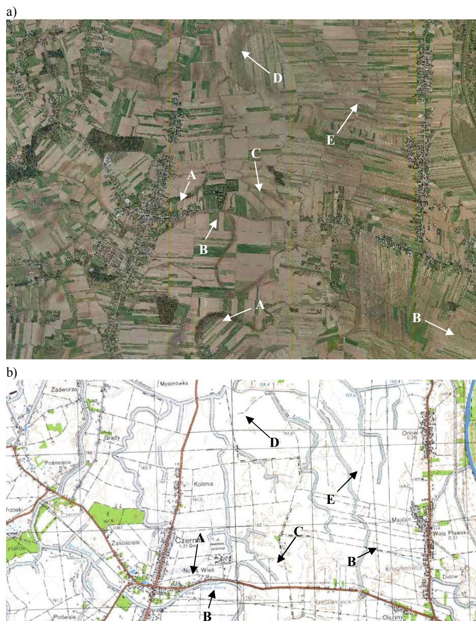
Rys. 3. Dolina rzeki Wisłoka w rejonie miejscowości Czermin i Wola Pławska: a) ortofotomapa (skala 1:50 000) [7]; b) mapa topograficzna (skala 1:50 000) [6].