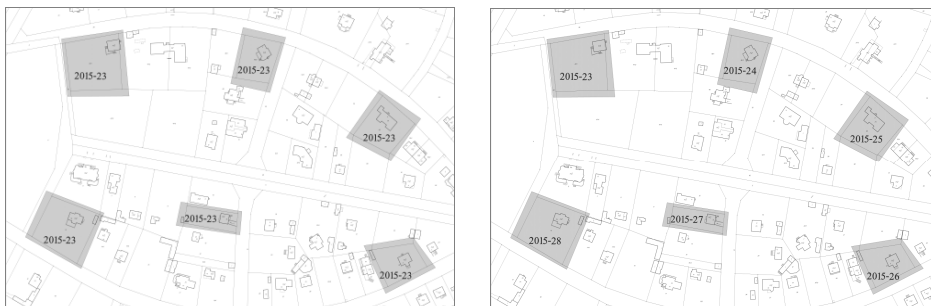
Rys. 1. Zakres pracy geodezyjnej określony jako multipolygon oraz ten sam zakres rozbity na pojedyncze prace geodezyjne