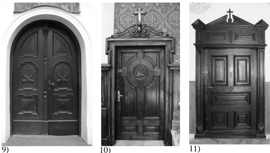
Fot. 9-11. Drzwi z kościoła i klasztoru oo. Franciszkanów (OFM)

Pfotos 9-11. The doors from the church and monastery of the Franciscan Reformatory