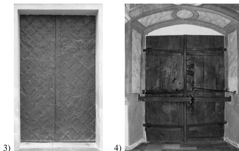
Fot. 3-4. Drzwi w transepcie kościoła pw. Matki Bożej Bolesnej

Pfotos 3-4. The door in transept the church dedicated to Our Lady of Sorrows