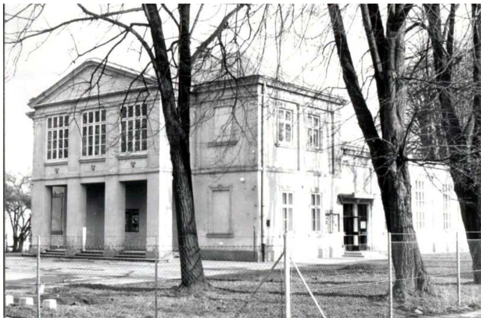
Ryc.3. Budynek „Sokoła” po wojnie. Wybito wejście od zachodu, nie ma sokoła na szczycie budynku.

Fig.3. The „Sokol” building after the war. Minted entrance from the west, there is no falcon on top of the building.