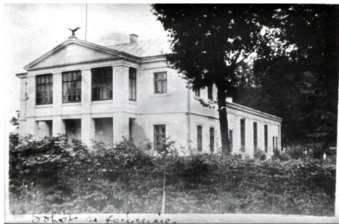
Ryc.2. Budynek „Sokoła” z figurą sokoła na szczycie obiektu, przed 1939 r.