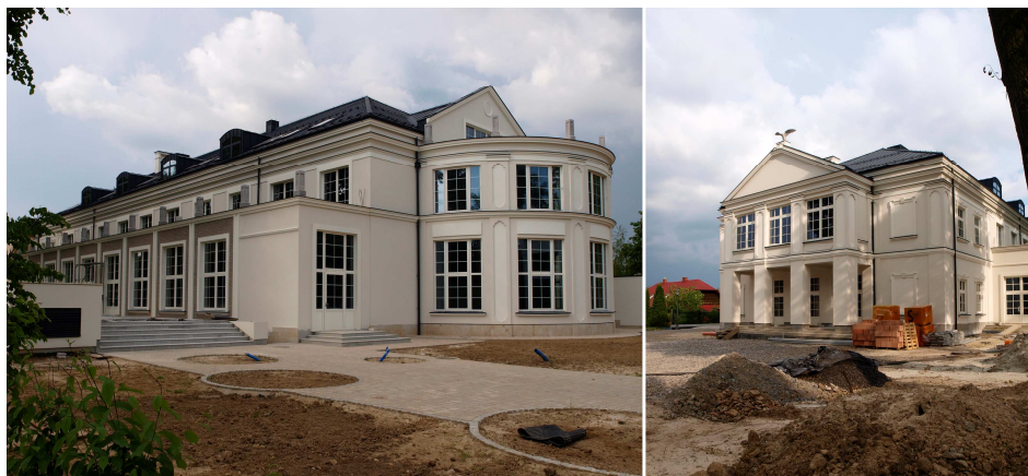
Ryc.4. Budynek „Sokoła” po przebudowie – stan istniejący 2014r. (autor: T. Huk)

usuwania architektury dokumentującej daną epokę i zastępowania oryginalnej architektury imitacją.