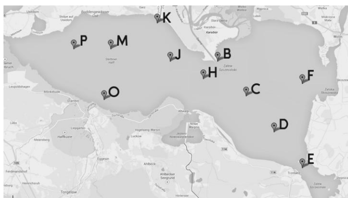
Rys. 1. Punkty pomiarowo kontrolne w Zalewie Szczecińskim