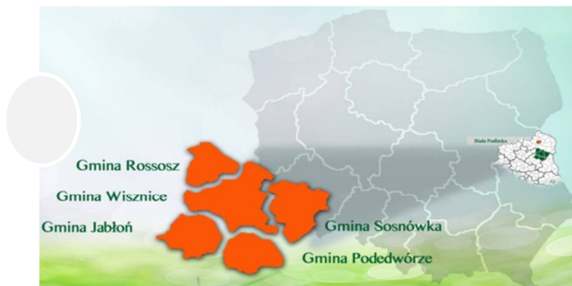
Rys. 1. Rozmieszczenie gmin partnerstwa „Dolina Zielawy”.