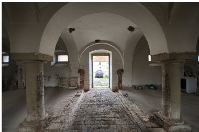
Rys. 4. Wnętrze budynku, fot. A. Władyka, Maj 2017

Obiekty wybudowane zostały metodą tradycyjną, posiadają kamienne fundamenty. Posadzki pierwszej kondygnacji częściowo kamienne, częściowo ceglane. Zarówno ściany konstrukcyjne jak i stropy wykonane zostały z cegły pełnej. Grubość ścian ok. 90 cm. Słupy skrajne murowane, wewnętrzne w większości wykonane z kamienia naturalnego (granit). Posadzki na drugiej kondygnacji ceglane.