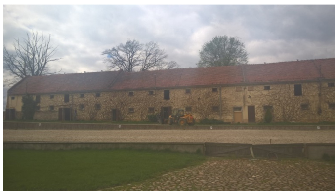
Rys. 2. Pierzeja zachodnia, fot. autor, Maj 2017

Ze względu na skalę rysunków zdecydowano się na nieumieszczanie rzutów poszczególnych kondygnacji.