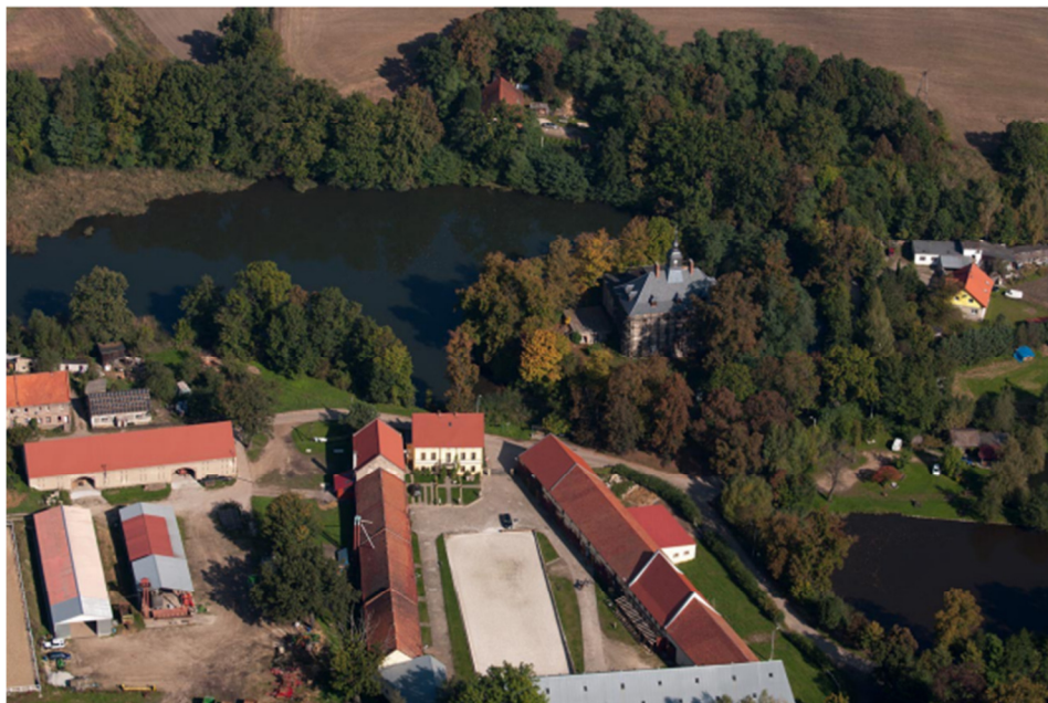
Rys. 1. Folwark Bagieniec