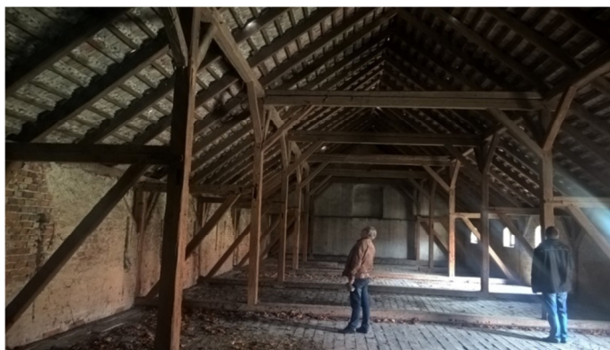
Rys. 5. Pierwsza kondygnacja, Maj 2017

Konstrukcja dachu drewniana. Poszycie dachowe wykonane z dachówki ceramicznej. Drzwi i okna zwieńczone granitowymi portalami.