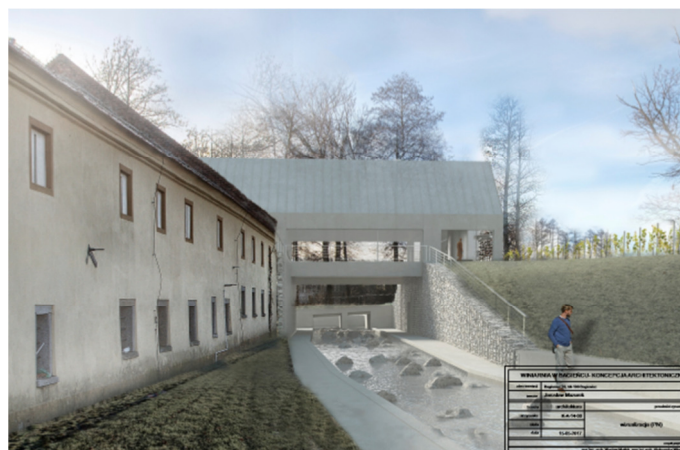
Rys. 8. Wizualizacja trzecia, fot. A. Władyka, Maj 2017

Fig. 8. Third visualisation, fot. A. Władyka, May 2017