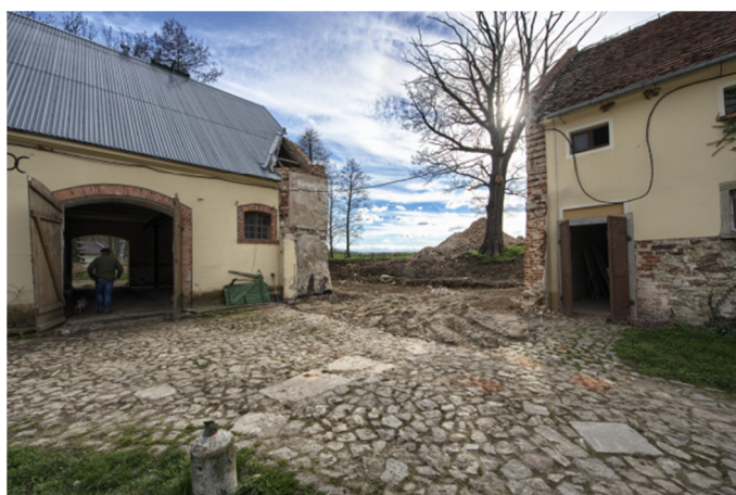
Rys. 3. Południowa i zachodnia pierzeja folwarku, fot. A. Władyka, Maj 2017

Elewacje zewnętrzne oraz wnętrza pokryte tynkiem cementowo-wapiennym o kolorach kolejno żółtym i białym. W południowo zachodnim narożu kwartału znajduje się wyrwa powstała na skutek zniszczenia istniejącej przybudówki.