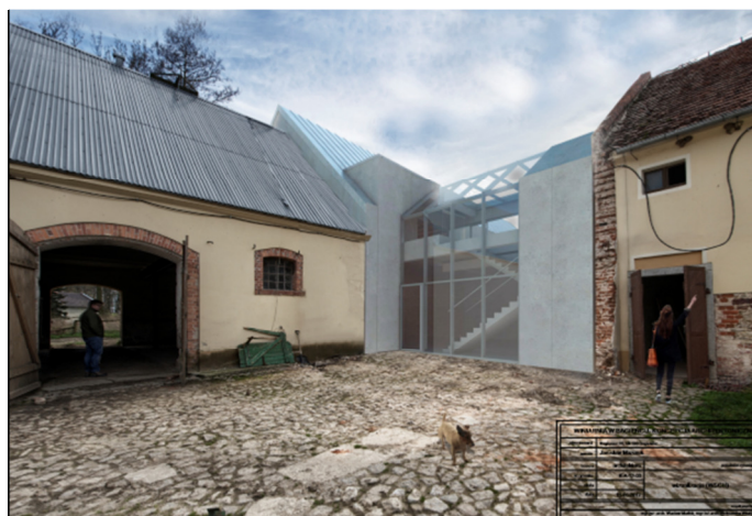
Rys. 6. Wizualizacja pierwsza, fot. A. Włodyka, Maj 2017

Ze względu na skalę rysunków zdecydowano się na nieumieszczanie rzutów poszczególnych kondygnacji oraz przekrojów.