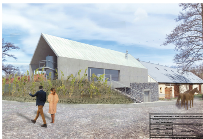
Rys. 7. Wizualizacja druga, fot. A. Włodyka, Maj 2017

Fig. 6. First visualisation, fot. A. Włodyka, May 2017